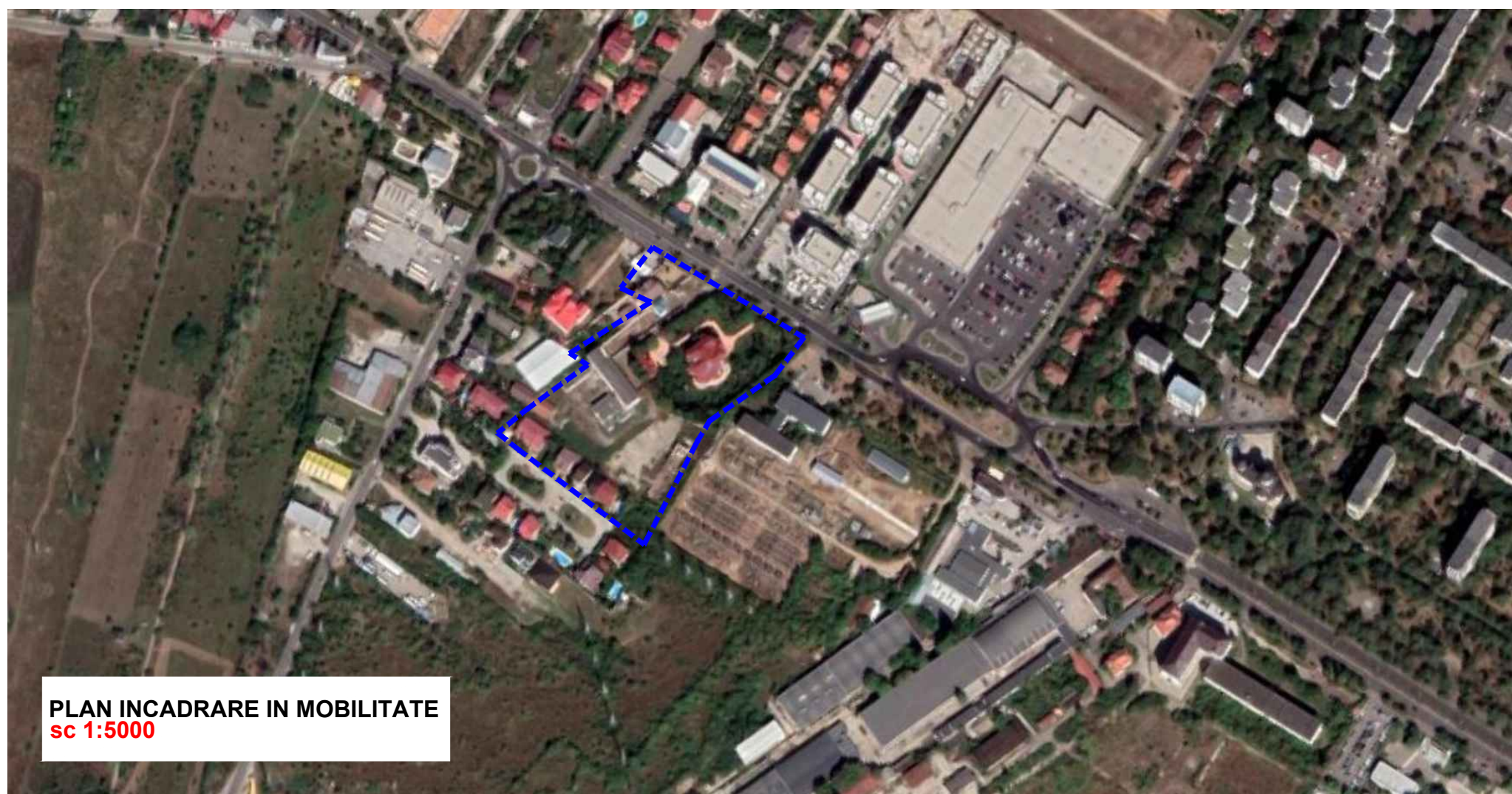
PLAN INCADRARE IN MOBILITATE sc 1:5000